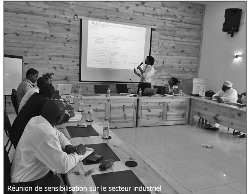
Réunion de sensibilisation sur le secteur industriel

L'objectif est d'abord d'identifier les contraintes au développement de l'industrie aux Comores, proposer des pistes de réflexion pour des solutions, identifier les opportunités. « L'idée de ce programme régional est de faciliter le partenariat entre industriels de l'Océan Indien à travers des programmes de mise en réseau pour l'exportation, la formation, l'assistance technique et le partage d'expériences », poursuit-il. Cet atelier a vu la parti-